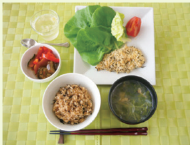
ひじき玄米ごはん、ささみでチャチャチャ、夏野菜のマリネ、あさりのガーリックスープ、レモンスカッシュゼリー