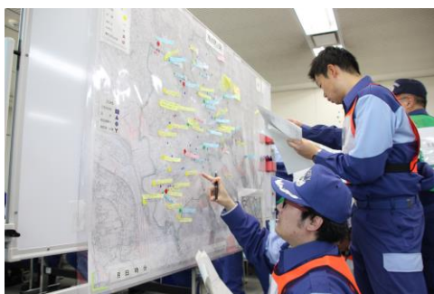
1枚の地図で正しい情報を共有します