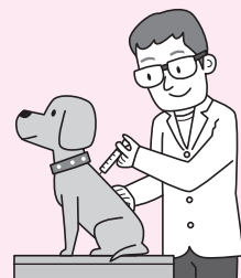
【表1】集合狂犬病予防注射日程表

かかりつけか、最寄りの動物病院で注射を受けて、生活環境課で手続きをしてください。一般社団法人上尾伊奈獣医師協会に所属する動物病院(表2)では、集合注射と同等の扱いで、予防注射と登録・注射済票の交付手続きができます。