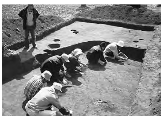
埋蔵文化財の発掘調査

【文化財保護法の対象】①農業基盤工事や造成工事などによる掘削が埋蔵文化財に及ぶとき②住宅などの恒久的な建物、道路その他の工作物を設置するとき③盛土または一時的な工作物の設置により、埋蔵文化財に影響を及ぼす恐れがあるとき