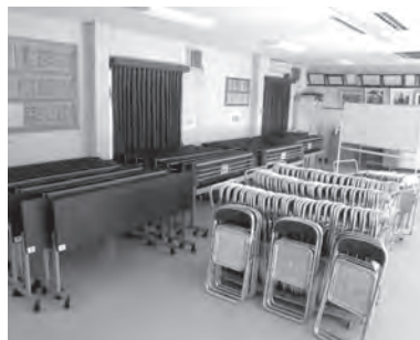
宝くじ助成で整備した集会所備品

会所備品(テーブル他) 園市民協働推進課 ☎775-4539・FAX775-9819