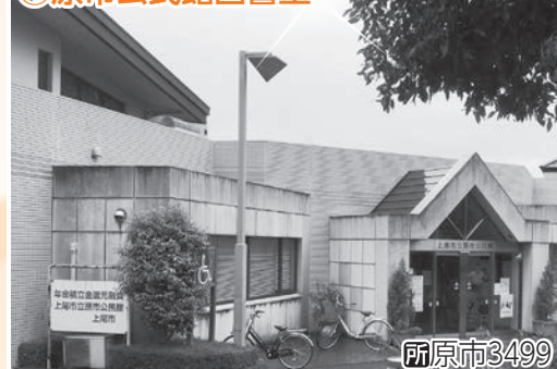
④原市公民館図書室

JR上尾駅に隣接し、予約した本を通勤通学の際に受け取る場所としても便利に利用されている分館です。