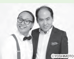
トレンディエンジェル

テレビでおなじみ『M-1グランプリ2015』出演者らによるお笑い祭りを文化センターで開催します! ① 6月5日(日)18時~(開場/17時30分) ② 所 文化センター 【出演予定】トレンディエンジェル、笑い飯、銀シャリ、メイプル超合金、スーパーマローナ、和牛、相席スタート、とろサーモン 他 ※都合により出演者が変更になることがあります。 【前売り券】販売期間/4月10日(日)~6月4日(土)(売り切れ次第終了) ③ 販売場所/文化センター、上尾市コミュニティセンター、チケットよしもと、チケットぴあ、ローソンチケット ※文化センターとコミュニティセンターでは、4月10日(日)7時から整理券を配布します(販売/9時)。 ④ 前売り券4,000円、当日券4,500円(全席指定) ※5歳以上有料、4歳以下で保護者の膝上に座る場合は無料、座席が必要な場合は有料です。当日券は文化センターだけで販売します。駐車台数に限りがありますので、なるべく公共の交通機関を利用してください。