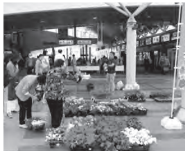
昨年のあげお朝市

市内で生産した農産物を農家が直接販売します。新鮮で安全な野菜、卵の他、季節の花や果実、ジェラートアイス、手作りまんじゅう(4~6月だけの販売など数多く取りそろえています)。 ④毎月第4(土)10時~12時30分 所JR上尾駅自由通路 ④農政課 ④775-7384・④775-9872