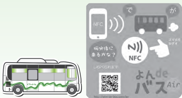
主要なバス停留所に貼られている「よんdeバスAir」のステッカー