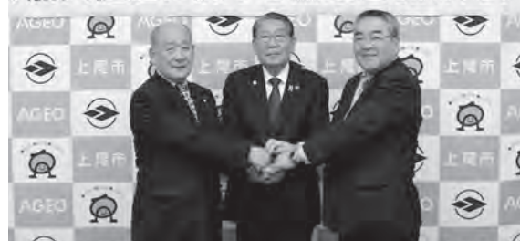
左から長島全日本不動産協会埼玉県本部大宮支部支部長、島村市長、大井川上尾市区長会連合会会長