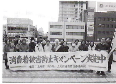
昨年の消費者被害防止キャンペーン

消費者被害を防止するため、市消費者団体連絡会と共催でキャンペーンを実施します。 11月9日(月)16時〜 16時J R上尾駅自由通路と東西ペデストリアンデッキ ④消費者被害防止を呼び掛け、啓発チラシ・消費者被害防止シールなどの配布 ⑤消費生活センター ⑥775-0800・⑦776-4600