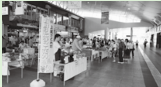
昨年のあげお朝市

毎回好評のあげお朝市は、4月から毎月開催します。市内で生産した農産物を農家が直接販売します。新鮮で安全な野菜や卵の他、季節の花や果実、ジェラートアイス、手作りまんじゅう(4～6月だけ販売)など数多く取りそろえています。 時 毎月第4(土)10時～12時30分 所 JR上尾駅自由通路