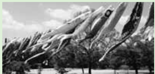
上尾丸山公園に掲げたこいのぼり(昨年)

5月5日(祝)の「こどもの日」に合わせて、市民の皆さんから寄贈されたこいのぼりを掲揚します。子どもたちの健やかな成長を願って、春の青空の下、色とりどりのこいのぼりが元気に泳ぎます。 期 4月24日(金)～5月10日(日) 所 上平公園(市民球場北側)、上尾丸山公園(児童遊園地北側池上)