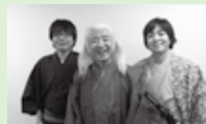
ご当地よしもと剣喜劇