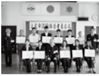
消防協力者の皆さん