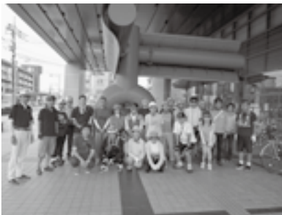
自転車健康モニターの皆さん