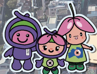
アップー あゆみ まゆみちゃん