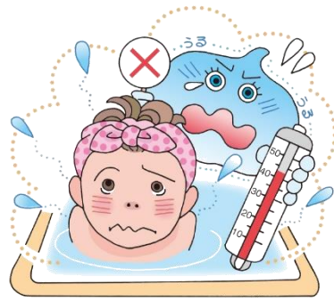
温度の高い(42℃以上)湯船に長くつからない。