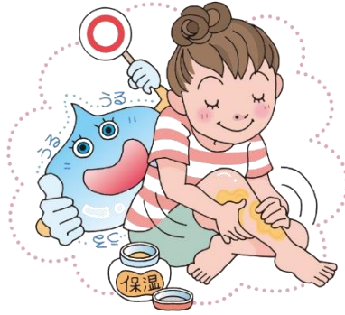
保湿クリームをぬる。

空気が乾燥する冬は、肌も乾燥してしまいがちです。肌が乾燥すると、かゆくなったり、ヒリヒリと痛くなったりしてしまいます。正しいケアをして、肌の潤いを保ちましょう。