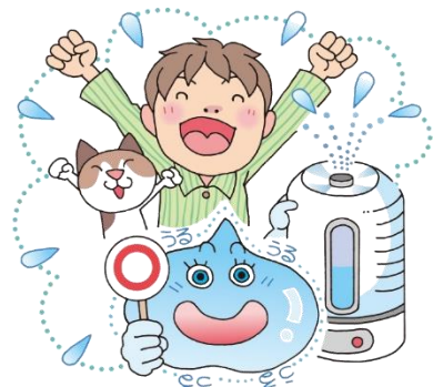
加湿器を使用する。