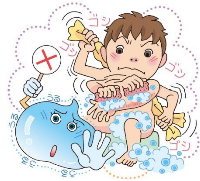
体をごしごし洗わない。