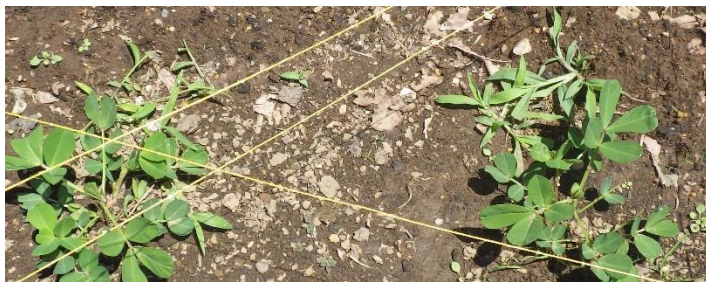
らっかせい 落花生