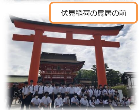
伏見稲荷の鳥居の前