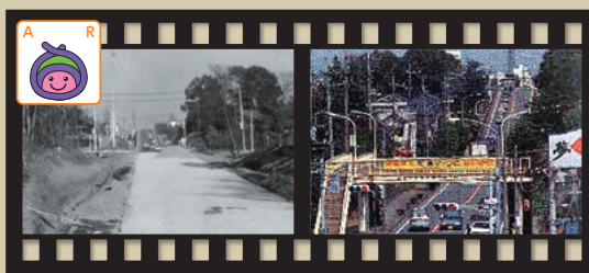
西宮下の上尾陸橋付近