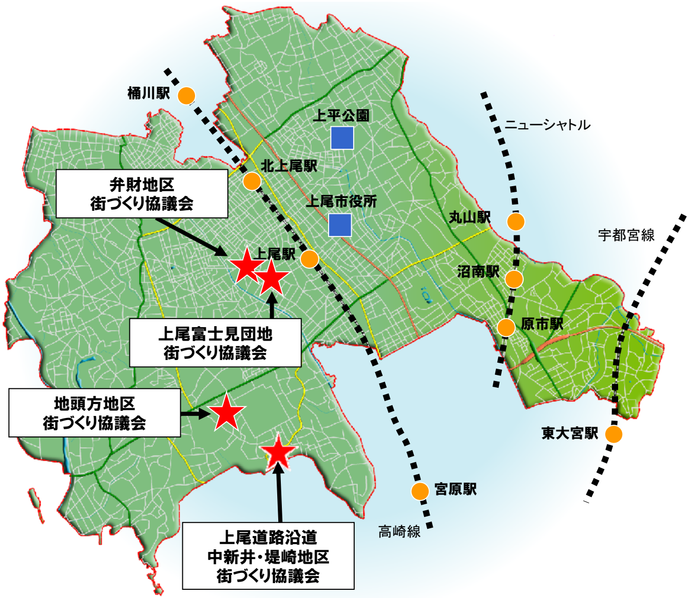
街づくり協議会位置図