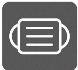
マスク着用 (咳エチケット)