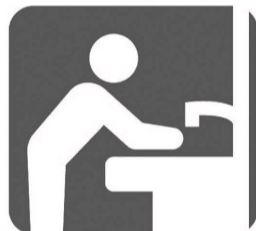
来場前後の手洗い