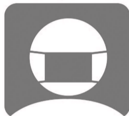
スタッフのマスク着用