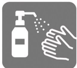
アルコール消毒液 の設置