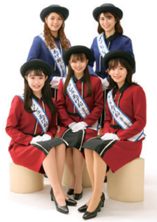
2021フレッシュあげお

験がある 【時給】 1,110円(令和3年度実績) 【通勤手当】 距離によって支給(予定) 定 20人程度 申 申請書(学務課にある。市ホームページからダウンロードも可)に 1 へ 国 学務課 ☎75-9604・☎75-5633