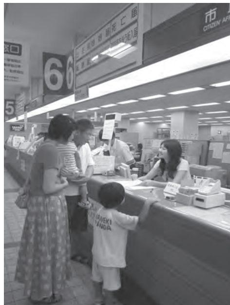
市役所窓口での様子

社会の複雑化、多様化とともに、地域の間人関係が希薄になってきています。独居世帯も増加する中で、市民が気軽に相談できる窓口の充実が求められています。☞施策 2)へ