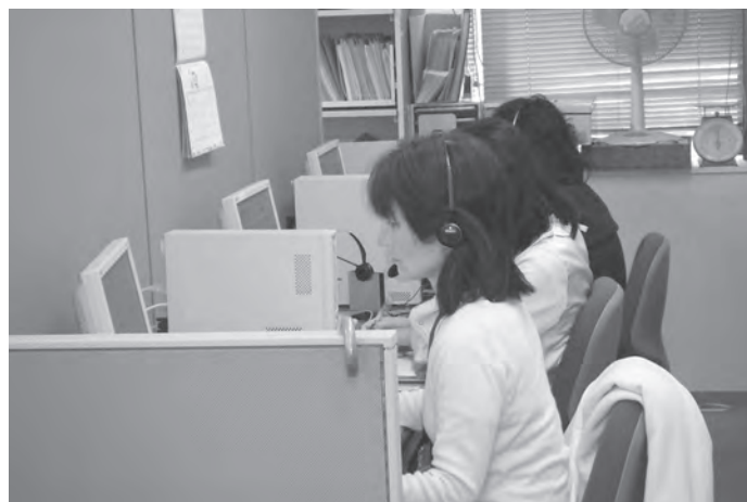
収納サポートセンター