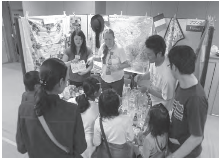
あげおワールドフェア