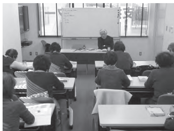
市民活動支援センター内の会議室