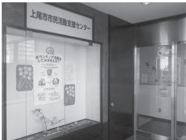
市民活動支援センター