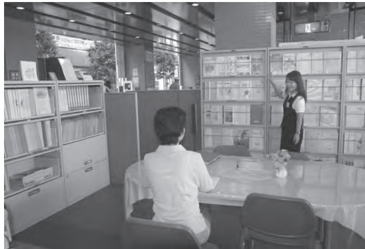
市役所の情報公開コーナー