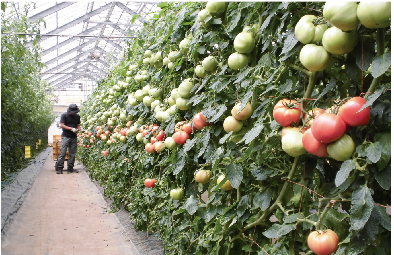
ハウストマト（上平・市ノ川園芸）