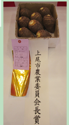
上尾市農業委員長賞