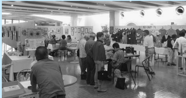
来場者でにぎわう作品展(昨年)

時7月6日(休)～9日(日)9～17時(6日は13時から、9日は15時まで) 所コミュニティセンター 内絵画・俳画・書道・写真・編み物・陶芸・木彫り・折り紙・和紙ちぎり絵・フラワーアレンジメントなど、コミュニティセンターで活動するサークルの作品展示