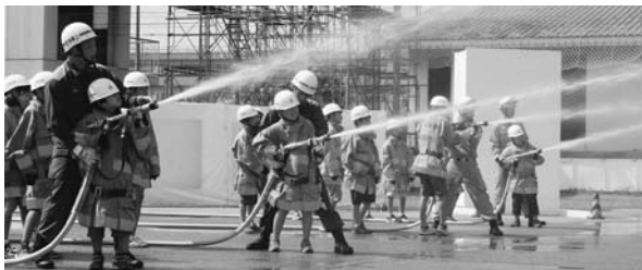
昨年の夏休み一日消防士での放水体験

時8月2日(水)9～16時 所市消防本部・東消防署 内消防車出動訓練、放水体験、すぐに役立つ応急処置、はしご車搭乗体験他 市内に在住の小学4～6年生 定50人(応募者多数の場合は抽選、初めて参加する児童を優先) 申往復はがきに住所、氏名(ふりがな)、性別、学校名、学年、保護者氏名、電話番号を記入して、7月7日(金)まで(当日消印有効)に予防課(〒362-0013上尾村537)へ