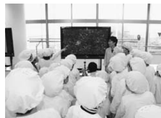
顕微鏡を使った乳酸菌の観察

「カルピス」を題材に、発酵の仕組みや食、自然と人のつながりについて楽しく学びましょう。 ☎8月22日(火)10時30分～(1時間30分程度) 所 コミュニティセンター 対 市内に在住の小学4～6年生 費 100円 定 20人(応募者多数の場合は抽選) 申 往復はがき(1人1枚)に講座名、住所、氏名(ふりがな)、性別、学校名、学年、保護者氏名、電話番号を記入して、7月28日(金)まで(必着)に消費生活センター(〒362-0075 柏座4-2-3)へ