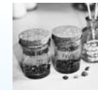
ジェルキャンドル

所ショーサンプラザ5階 親子で上記の作品を作る(所要時間15～30分) 費1講座300～500円 申7月5日(水)までに専用ホームページ(☎https://ws.formzu.net/fgen/S55201958/)で ※当日参加も受け付けます。(協力:High FiveMom)