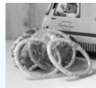
チューブプレット