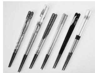
オリジナル「マイ箸」

プロ野球で折れたバットを再利用して、自分の手のサイズに合わせた世界でたった一つのオリジナル「マイ箸」を作ってみませんか。お箸の歴史や文化、正しい箸の持ち方、マナーを学びましょう。 ※箸は後日郵送します。 ☎7月30日(日)13時30分～(2時間30分程度) 所 コミュニティセンター 対 市内に在住の年長児～小学生と保護者 費 1,780円(1人1,620円、1家族3人まで送料160円) ※保護者1人につき子ども2人まで参加可能です。 定 15組(応募者多数の場合は抽選) 申 往復はがき(1組1枚)に講座名、住所、氏名(ふりがな)、性別、学校名(幼稚園・保育園含む)、学年、保護者氏名、電話番号を記入して(子ども2人参加希望の場合は2人分)、7月14日(金)まで(必着)に消費生活センター(〒362-0075 柏座4-2-3)へ