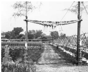
写真2 昭和40年代の川の大じめ旧道を遮る市民体育館通りがまだない。