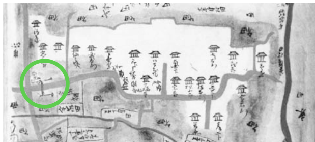
写真1 明治初年に描かれた旧川村の絵図道をまたいで大じめと、傍らに庚申塔が描かれている。