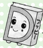
あっぴいぶっくるのキャラクター「アッピー」

乳幼児・小学生の皆さん、イベントに参加するときは「読書パスポート」「えほんのきろく」を持ってきてね! スタンプを押すよ!