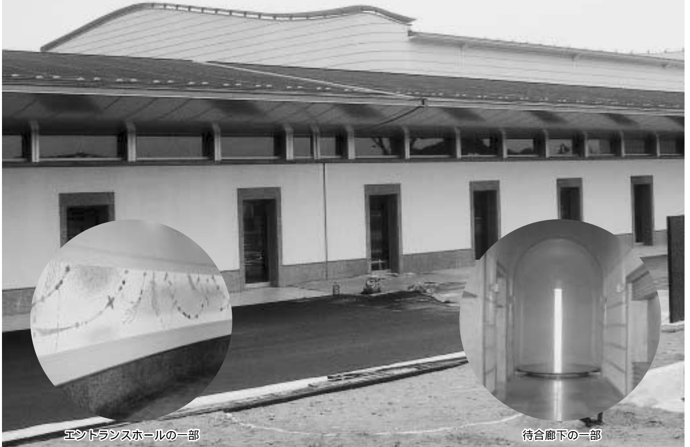
エントランスホールの一部