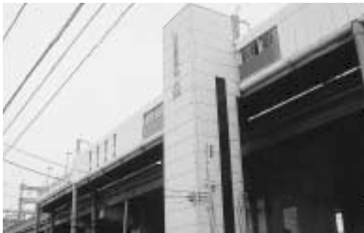
公衆トイレが設置されるニューシャトル沼南駅

市道路線の認定 については、市目地内東西地下連絡道路整備事業の実施に伴う市道の認定や道路の用に供するものとして寄附を受けまたは市に帰属をした土地を市道として認定したいので、定めるところにより提案するものです。