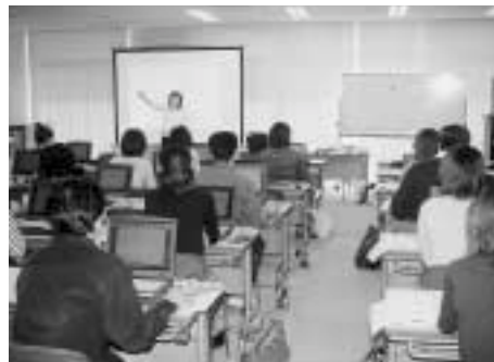
再就職を希望する人のパソコン教室(プラザ22)

答 若年者を取り巻く就職環境は、非常に厳しい状況が続いている。この背景には、企業の先行き不安感が払しょくされないことから、新規卒者の採用に対する慎重な姿勢が見られることや、企業の求める人材の高度化などにより雇用場が著しく減少している。また、若年者側の問題として、職業意識の希薄化や基礎的な能力不足などが挙げられる。そこで、若年者の就職活動支援については、大変重要な施策として