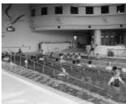
入館者の多い健康プラザわくわくランド

委員 関連で、衛生管理の問題はどのように対応しているのか。 答 委託業者が絶えず巡回してごみ掃除もしている。また、レジオネラ菌を含め水質検査を行っている。