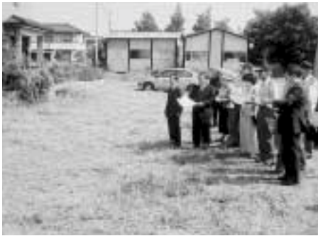
(仮)平方分署予定地を現地調査する福祉消防常任委員会