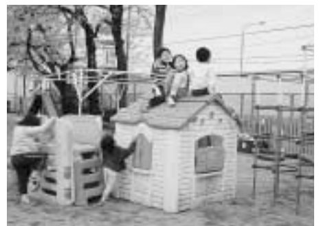
元気に遊ぶ幼児（小敷谷保育所）

また幼保一元化については、幼稚園と保育所が異なる目的と役割を果たすため、それぞれの設置基準を満たす必要があり、幼稚園教諭免許と保育士資格の総合取得の促進、保育所の調理室必置義務の見直しなどの問題がある。 働く母親の増加に伴い、幼稚園における預かり保育の充実、保育所においては幼稚園と同様の幼児教育の実施などが求められている。すべての子供の健全な育成を図るため、市としても幼稚園と保育所の機能を生かし、利用者のニーズにこたえていくよう努力していきたいと考えている。