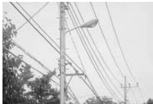
増設が望まれる道路照明灯

道路照明灯の設置については、今日まで公道を対象にしてきたが、今後安心して安全な明るいまちづくりを推進していく上では、私道への設置も必要なことと考えている。現在、111事務区に対し設置状