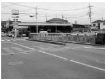
改修予定のすずむき橋

答 橋台のコンクリートと橋げたとの間に季節により伸縮するすき間があり、そこに硬質ゴムを入れて柔軟性を取ることでより振動音を解消するものである。だいぶ年数が経過し磨耗していて、交通量が多いために振動音が激しく、付近住民に迷惑をかけている状態である。