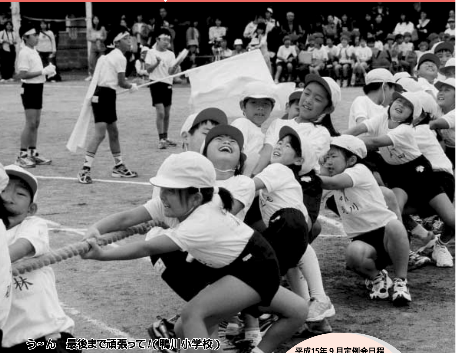
う〜ん 最後まで頑張っ!(鴨川小学校)