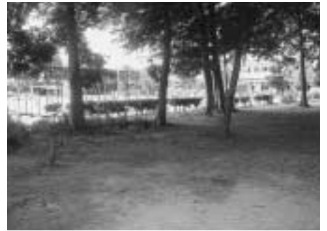
新築予定の大石学童保育所予定地(大石小学校内)

委員 設置が待たれていただけに良かったと思う。しかし、予定地については、卒業生たちによって自然を残そうという場所でもあると聞いている。その辺を配慮しながら学童の皆さんや学校側とも話し合いを持って、より良いものを作っていたきたい。