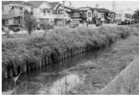
早期の水害解消が望まれる鴨川

問 これから台風シーズンを迎え鴨川流域に居住している方々の水害に対する心配、不安な気持ちを早期に解消していく必要がある。