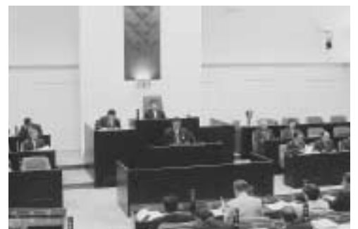
9月定例会市長の提案説明

衛生事業 としては、生活排水処理を経済的観点も加え抜本的に見直すための基本計画策定の委託料を新たに計上しました。また、健康プラザわくわくランドでは、一