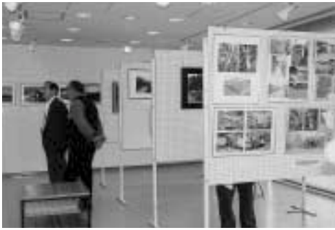
市役所ギャラリーで開催された写真展

覧会や発表会の後援などの文化・芸術活動の推奨と施設などの整備推進を位置づけている。 今後、文化・芸術を振興するための基本的な方針や計画を策定する必要性、芸術団体など文化振興の推進者となる人材の育成をさらに図る必要があると考えている。 また、文化芸術振興基金についても基金の基盤強化、活用を図り、貴重な基金を生かす運用を図っていききたい。