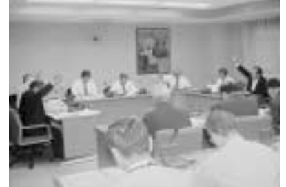
建設水道常任委員会の審査の様子