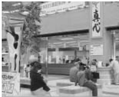
市庁舎1階市民ホール

答 市制施行45周年の上尾市は人間に例えると働き盛りの壮年期を迎え、子育て支援センターを併設した保育所の開所や、全国に先駆け実施した小学校低学年の30人学級など福祉、教育に重点をおいており、斎場の完成によ