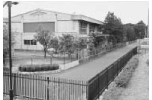
ランニング走路として整備された瓦葺中学校外周道路

答 斎場周辺の整備については、平成9年12月に瓦葺古川耕地まちづくり研究会、また平成11年2月には、その支援組織として原市地区葬斎場建設推進協議会が発足し取り組んできた。その中で、斎場建設のほか、周囲の景観や周辺地域の環境整備、また県道からの進入道路の位置や幅員、