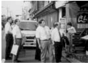
文教経済常任委員会の川越市視察の様子