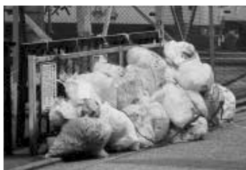
カラス被害防止のためネットで覆われた集積所のごみ