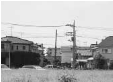
住環境整備が望まれる地頭方地域

問 地頭方地域は、道路の幅が大変狭く、車のすれ違いができない状態である。また、排水の整備も十分されているとは言