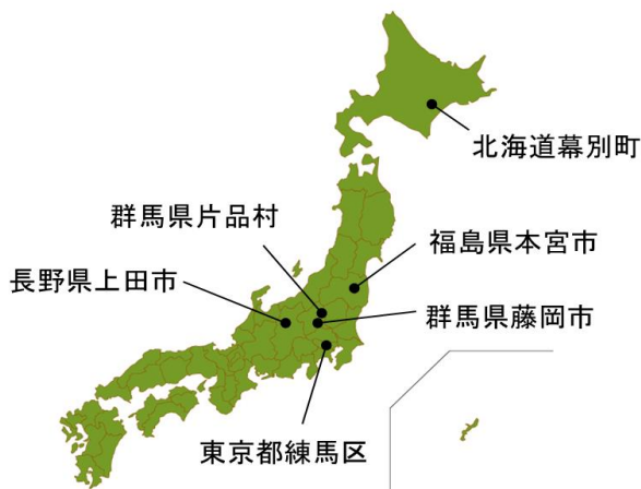
防災協定締結自治体(県外)